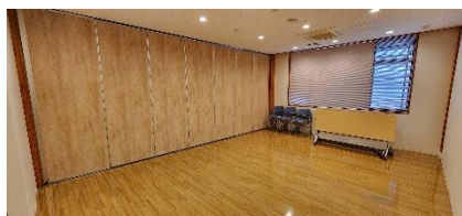
※ 会 議 室 B